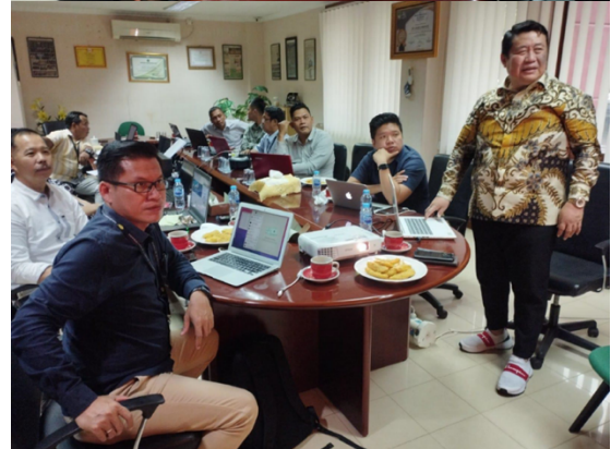
Foto 4, Foto Kegiatan Pemantapan